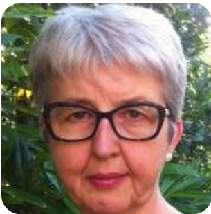
Bibliothécaire et historienne