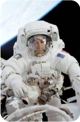
Invité d'honneur : spationaute et pilote d'essai

Philippe PERRIN nous propose : "Voyage dans l'espace : une expérience du corps et de l'esprit"