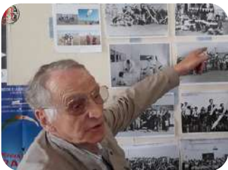
Historien et aviateur