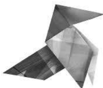
La feuille volante